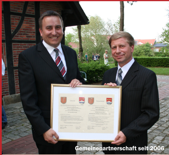
Gemeinepartnerschaft seit 2006